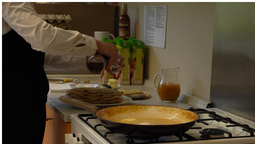
DEN PRO VEŘEJNOST