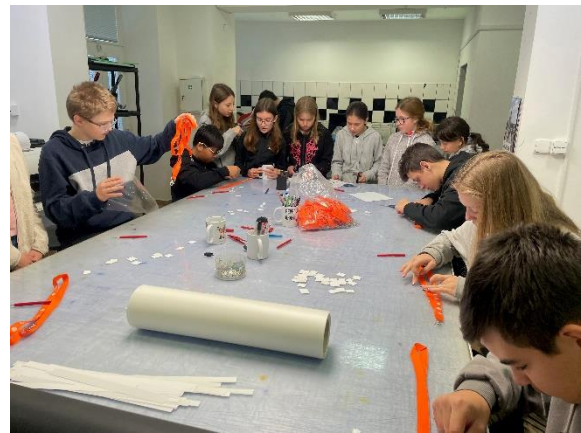
Projektový den pro ZŠ Košetice