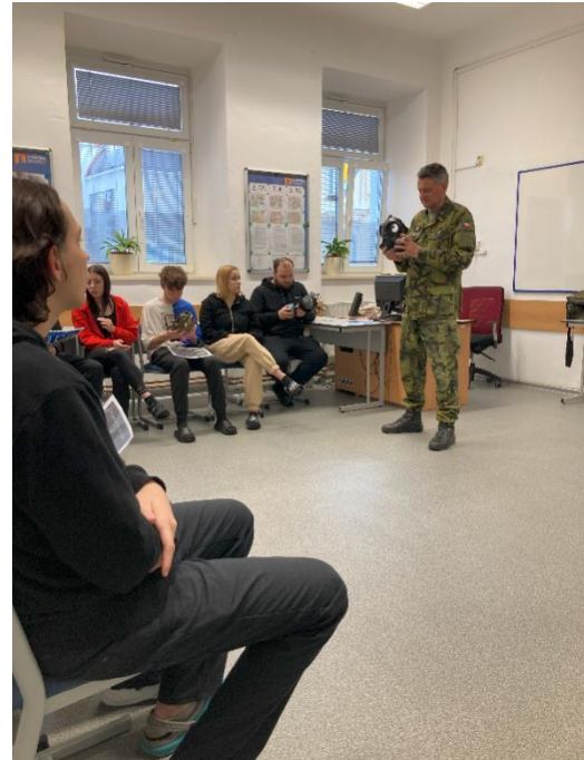
Den s armádou