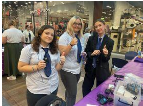
Vysočina Education Festival