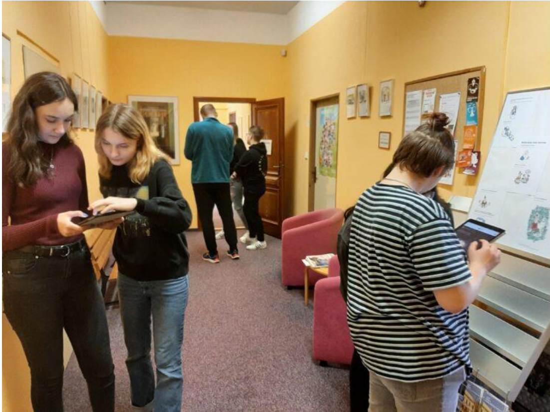
Goethe Zentrum Pardubice