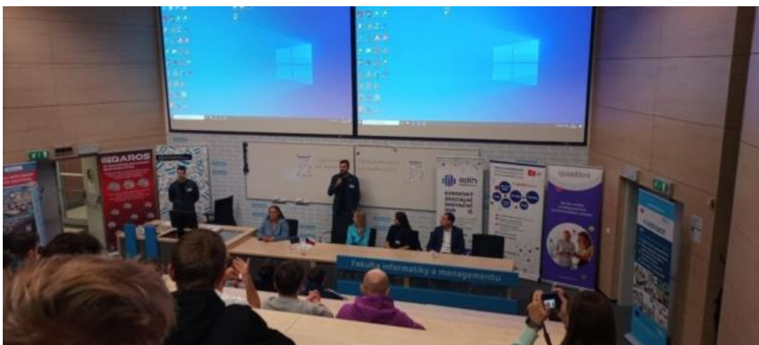
Hackathon v Hradci Králové