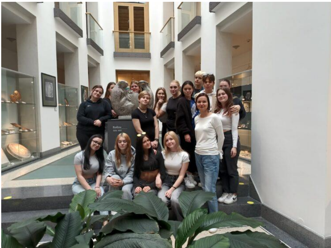
Exkurze do ČNB