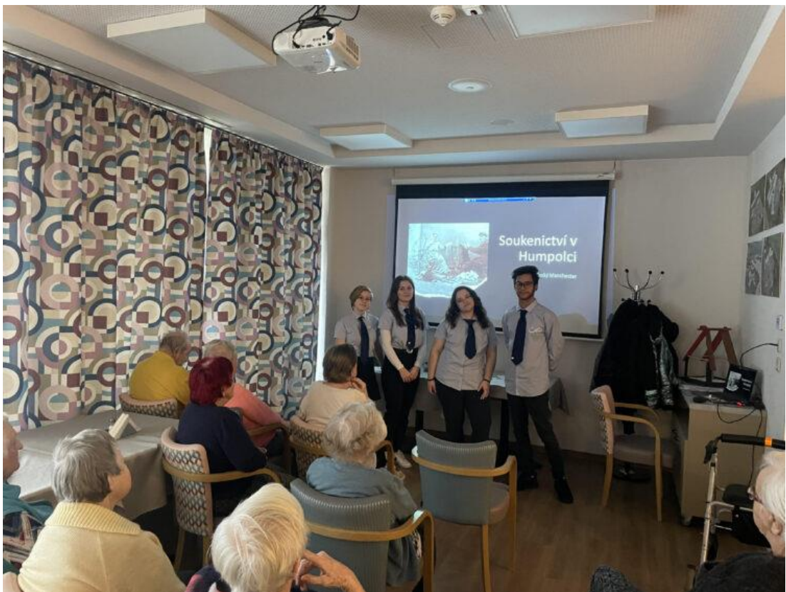
PŘEDNÁŠKA PRO KLIENTY SENIORSKÉHO CENTRA