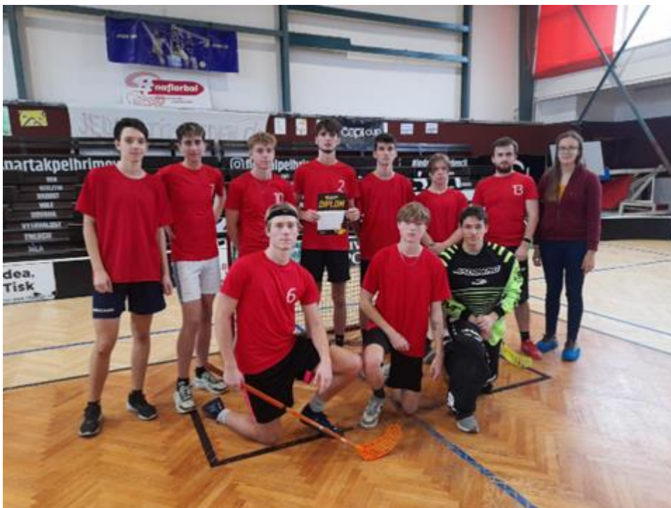
Florbalový turnaj v Pelhřimově