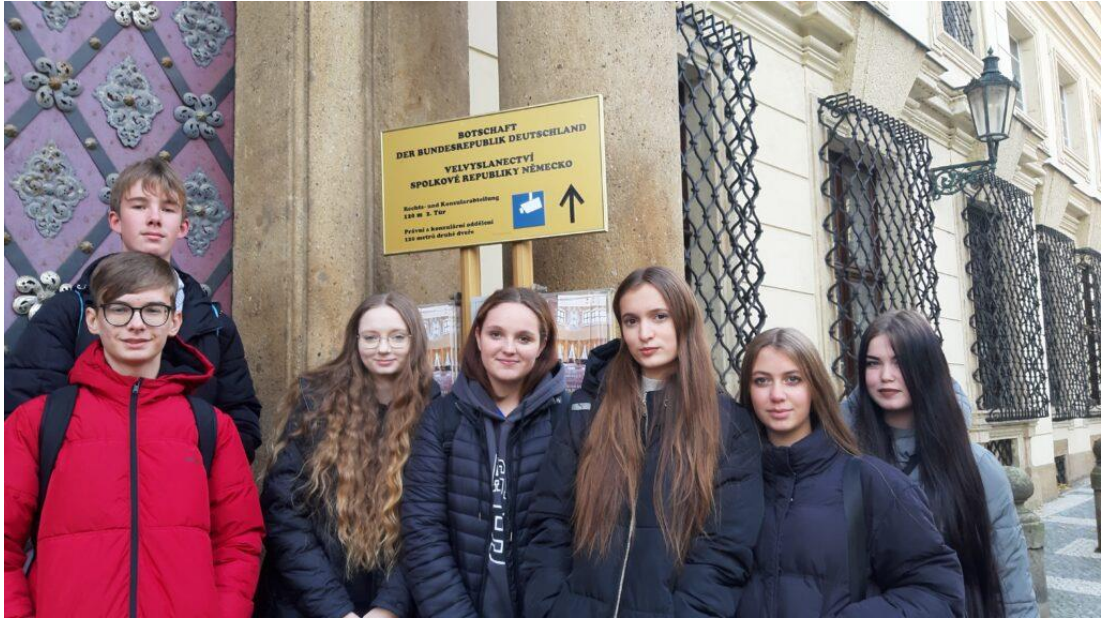
Návštěva německého velvyslanectví