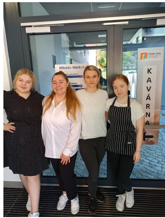
KAVÁRNA MIKÁDO MARKET