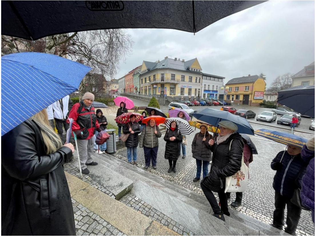
POCHOD PRO MOZEK