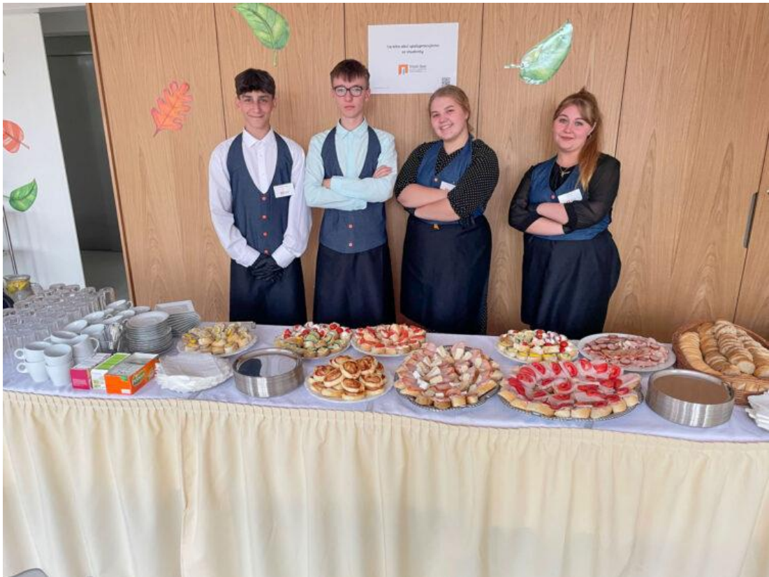
SLAVNOSTNÍ OTEVŘENÍ MŠ HRADSKÁ