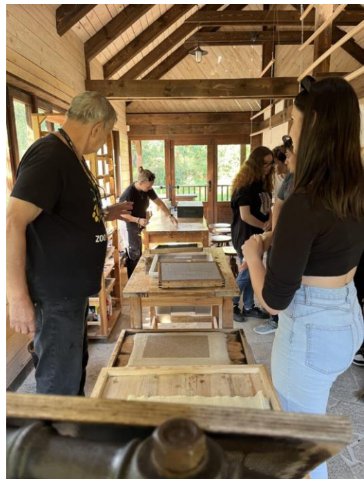
Výroba ručního papíru