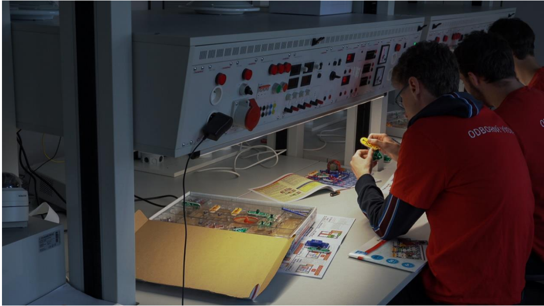
DEN PRO VEŘEJNOST